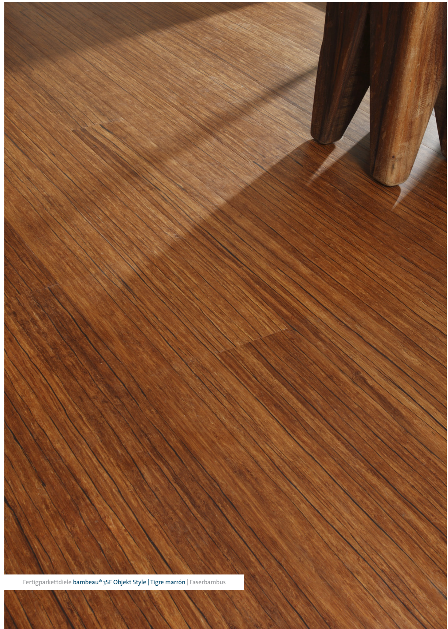
Fertigparkettziele bambeau® 3SF Objekt Style | Tigre marrón | Faserbambus