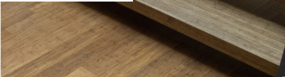
Plattenmaterial für Massivtritte

Weitere Informationen und Bilder finden Sie auf unserer Homepage www.bambeau.de