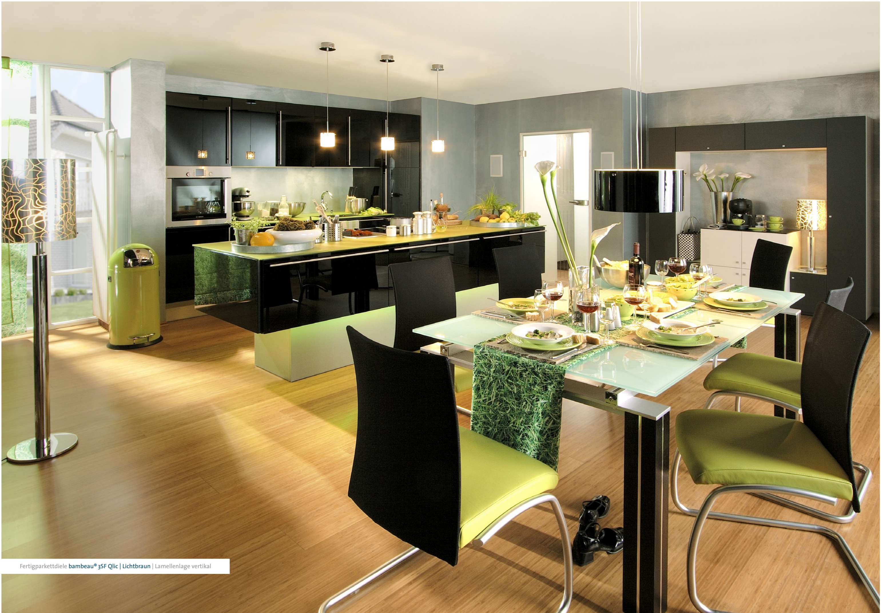
Fertigparkettdele bambeau® 3SF Qlic | Lichtbraun | Lamellenlage vertikal