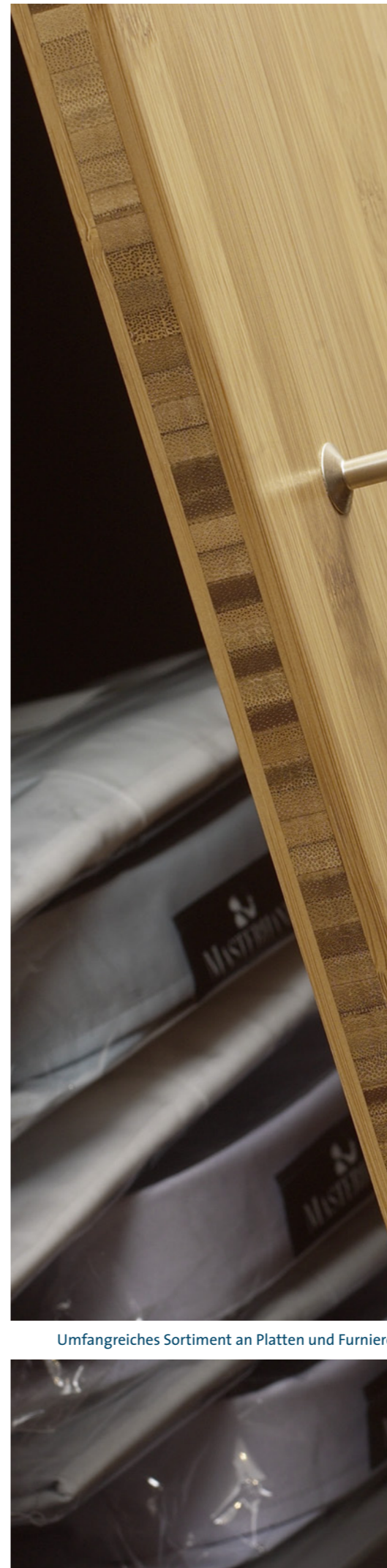
Umfangreiches Sortiment an Platten und Furnieren für den Möbel- und Innenausbau