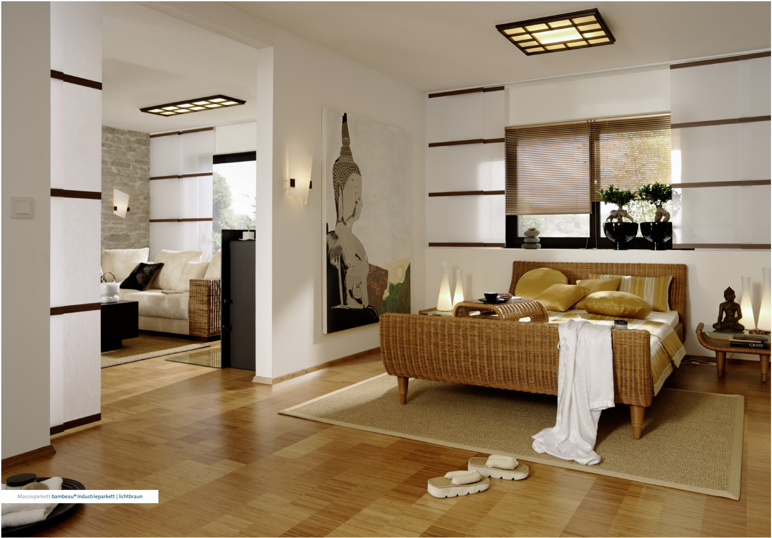
Massivparkett bambeau® Industrieparkett | lichtbraun