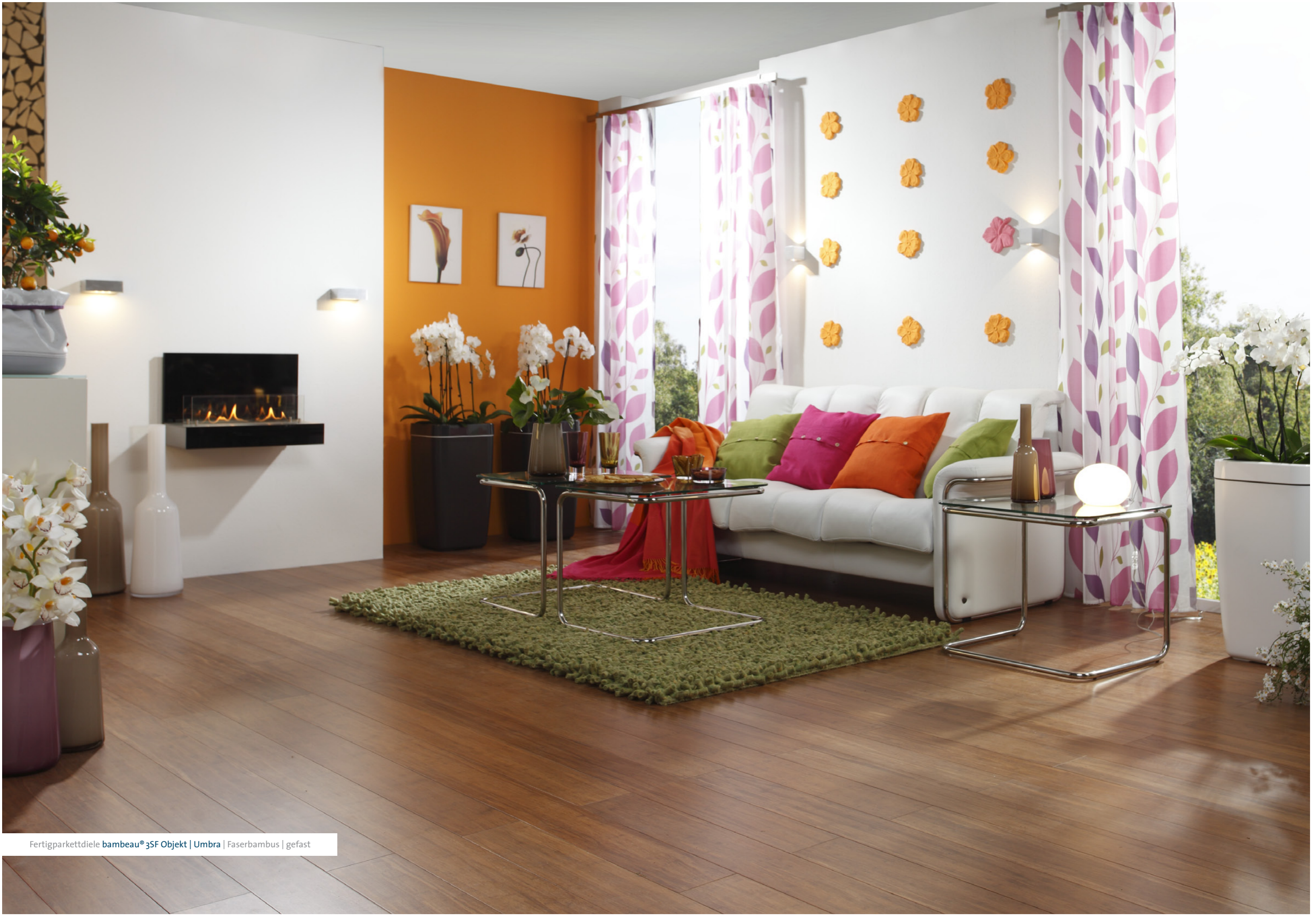
Fertigparkett diele bambeau® 3SF Objekt | Umbra | Faserbambus | gefast