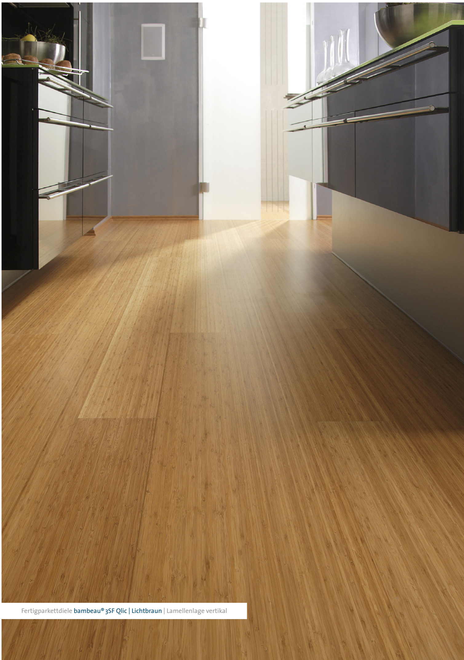
Fertigparkettziele bambeau® 3SF Qlic | Lichtbraun | Lamellenlage vertikal