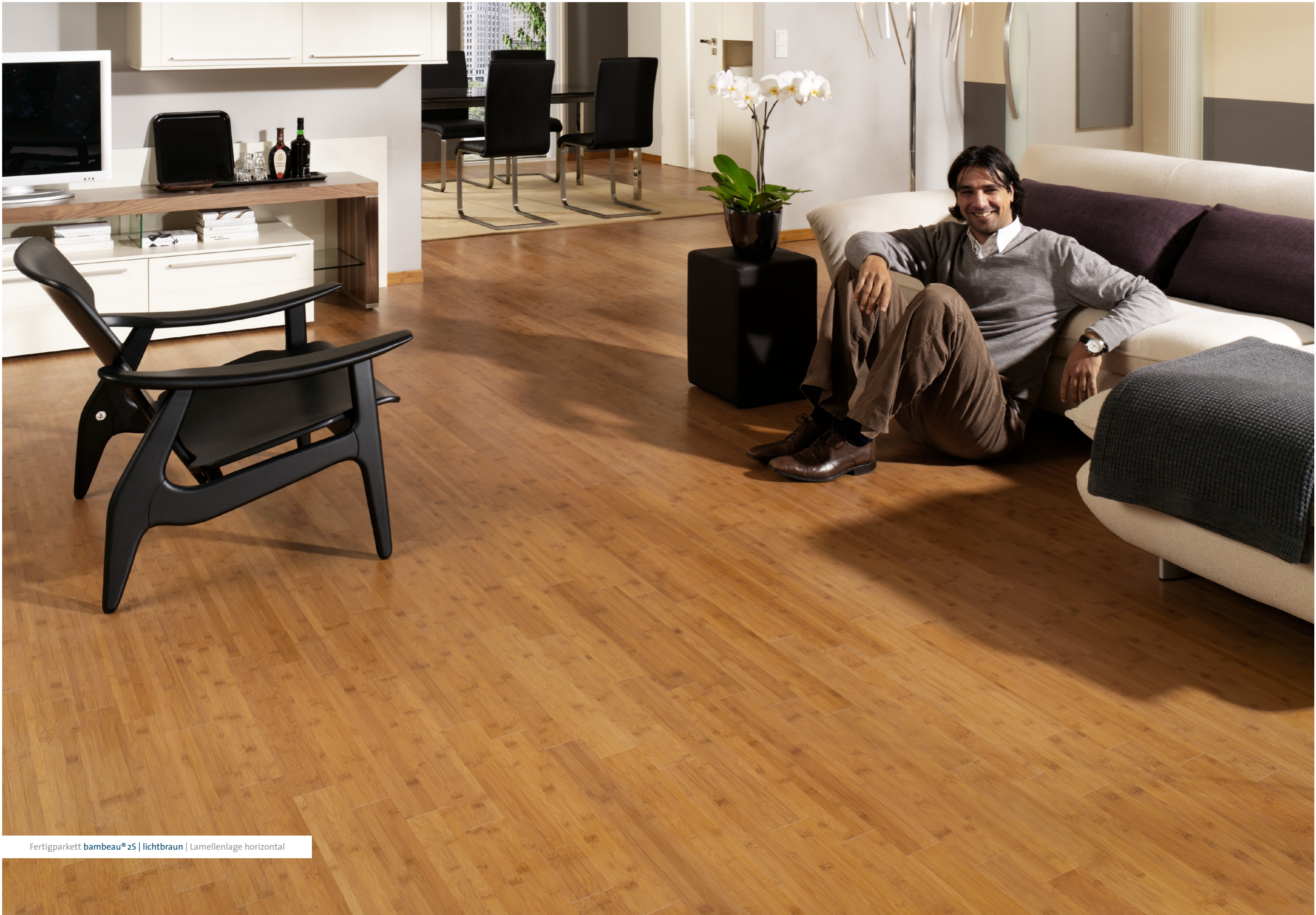
Fertigparkett bambeau® 2S | lichtbraun | Lamellenlage horizontal