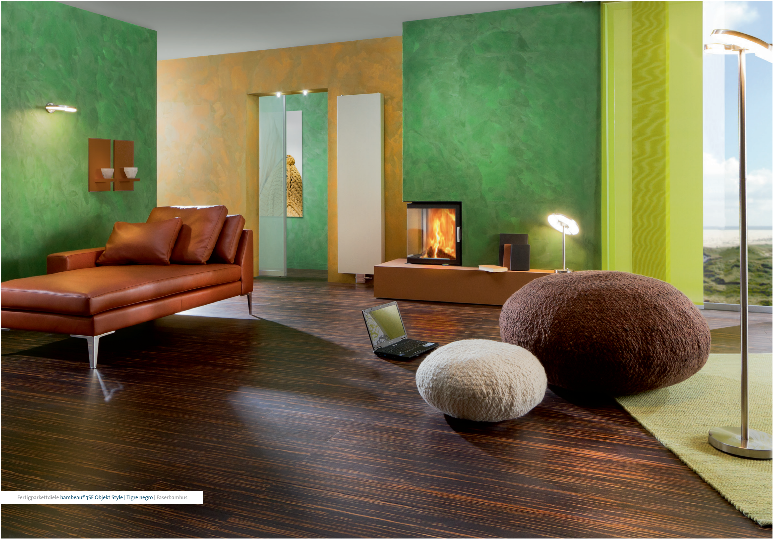
Fertigparkettziele bambeau® 3SF Objekt Style | Tigre negro | Faserbambus