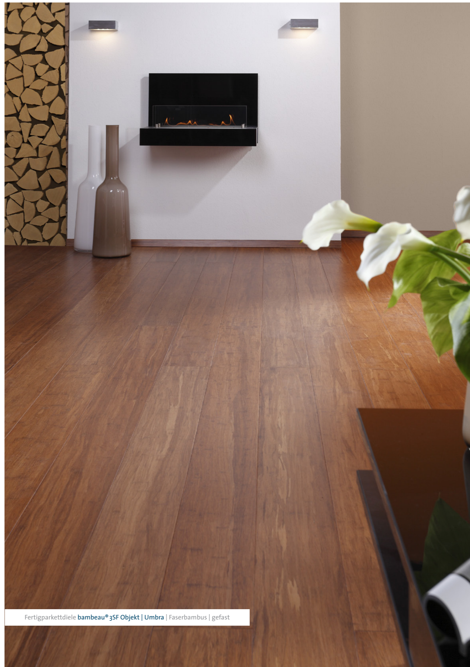
Fertigparkettziele bambeau® 3SF Objekt | Umbra | Faserbambus | gefast