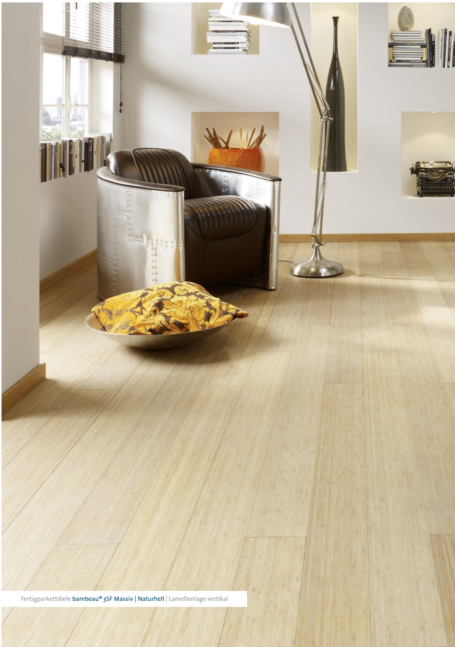
Fertigparkettziele bambeau® 3SF Massiv | Naturhell | Lamellenlage vertikal